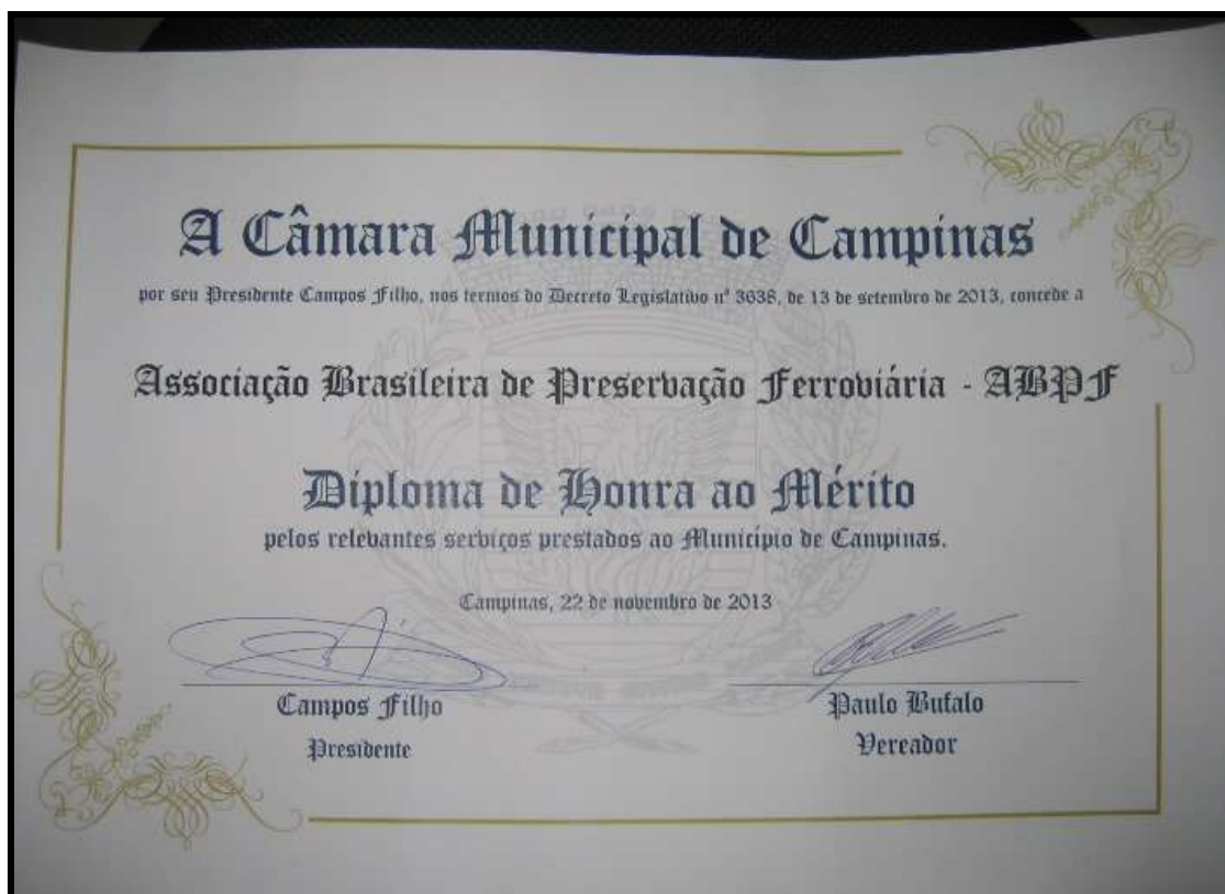
Diploma de Honra ao Mérito concedido pela Câmara Municipal de Campinas à ABPF.