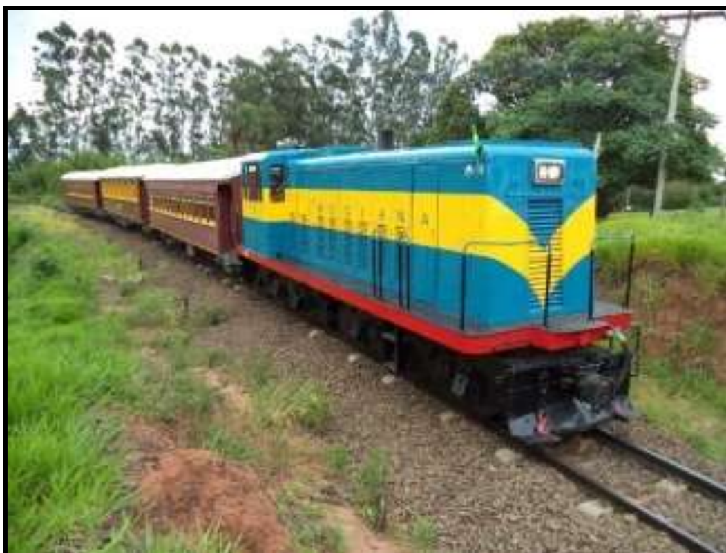
Locomotiva diesel número 3 com o trem de meio-percurso.