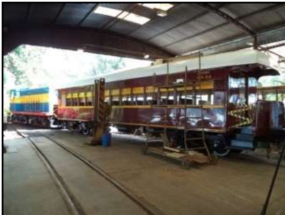
Carro SPP CA-44 ainda nas Oficinas de Carlos Gomes.

repintura e melhoria nos sistemas de freios. Este carro já veio com rodas de última vida, mas frisos bons que ainda trabalharam por 10 anos. O mesmo será içado com os quatro macacos elétricos, retirando-se os dois truques simultaneamente.