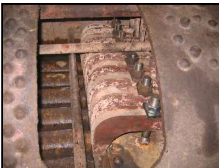
Vista da caldeira da Locomotiva 50 que está em restauração.

A locomotiva diesel GE número 3 trabalhou todos os domingos do mês de novembro, fazendo o trem do lado de Jaguariúna, e como “helper” nos trens que partem de Anhumas. Nos horários da tarde a locomotiva fazia o trem de meio percurso, poupando-se locomotivas a vapor e lenha. Para facilitar sua manutenção, adquirimos um bico injetor e uma bomba injetora para fazer substituição em caso de falha e, com isso, não interromper a operação da locomotiva. No próximo mês, haverá uma parada mais longa para inspecionarmos os cabeçotes e cilindros do motor diesel.