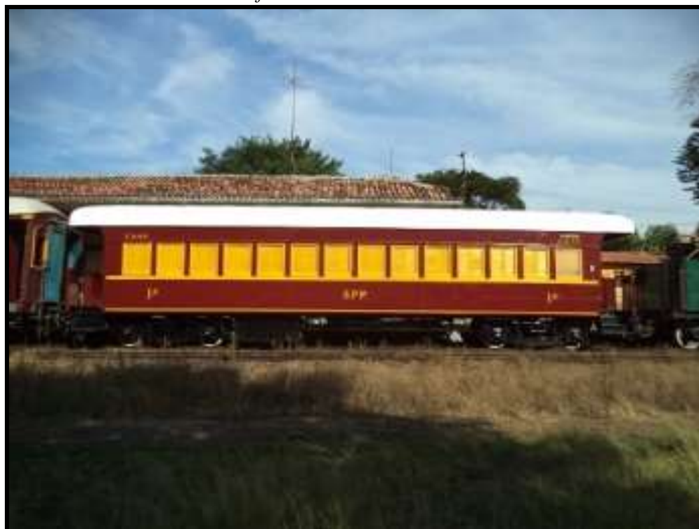
Carro CA-44 já de volta ao tráfego.