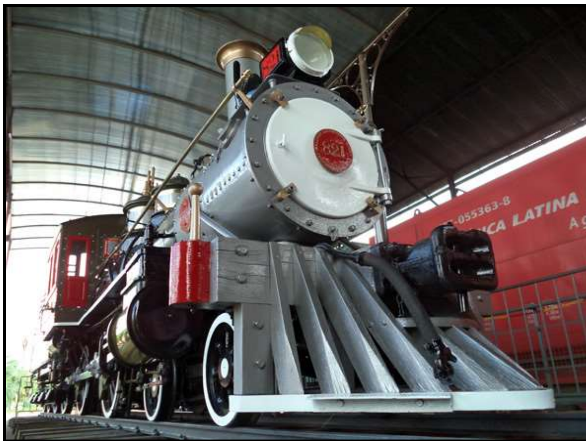
Como ficou a locomotiva 821 após a recuperação estética.